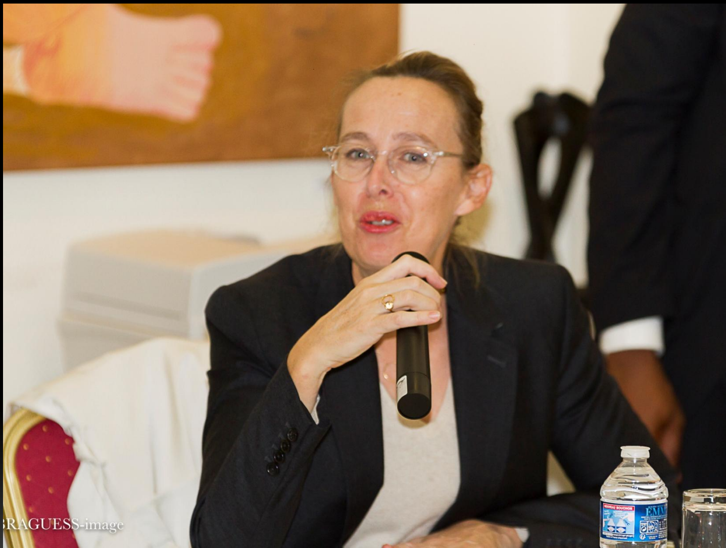
Mme Valérie PENEAU Inspectrice générale de l'administration FRANCE